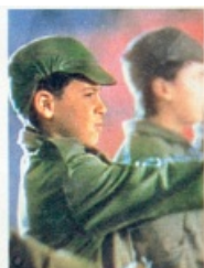
Dijalais [redacted] wird zum Terroristen umerzogen