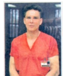
Dieter [redacted] wurde in den USA zum Tode verurteilt