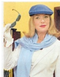
Elvira [redacted] spielt eine Mutter von Welt