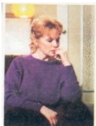
Hat Angelika ihre Schwester Beate niedergeschlagen?